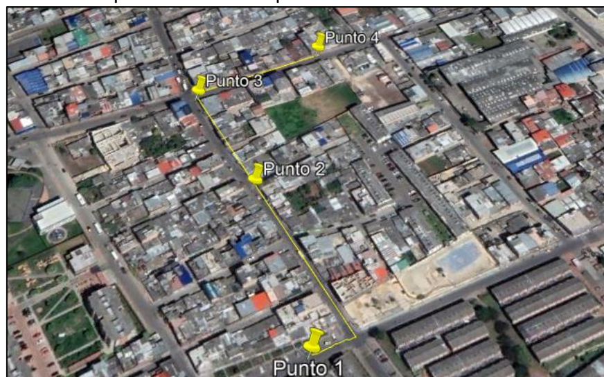
Ilustración 1. Recorrido

Se realizó recorrido de control y vigilancia en el cuadrante 2, barrio SEREZUELITA el día 18 de marzo del 2024, desde las coordenadas 4°42'24"N-74°12'31"W hasta las coordenadas 4°42'32"N- 74°12'31"W (ver ilustración 1. Ruta amarilla), con el fin de verificar las condiciones ambientales, identificar posibles afectaciones a los recursos naturales y realizar las acciones de prevención correspondientes.